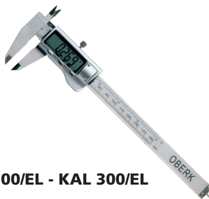
KAL 200/EL - KAL 300/EL