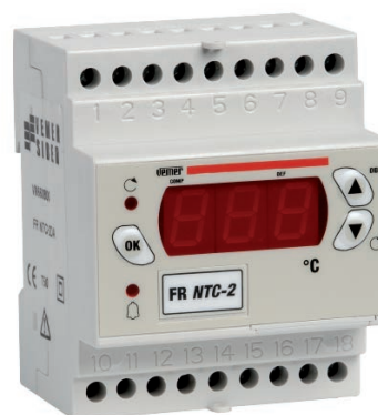
MODULARE 4 DIN