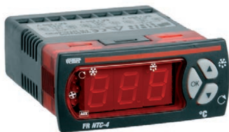
DA PANNELLO 33x75