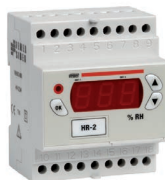
MODULARE 4 DIN