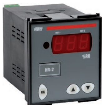
DA PANNELLO 72x72