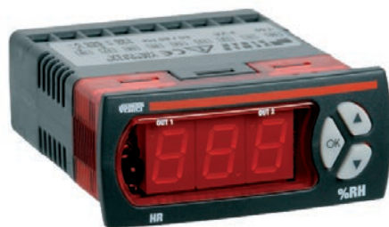
DA PANNELLO 33x75