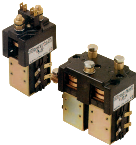
Serie TL40 - Unipolari 220A Serie TLD48 - Teleinvertitori 220A