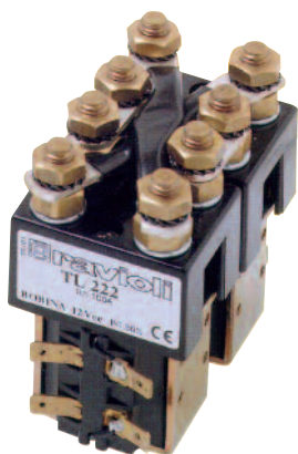
Serie TL222 Teleinvertitori 150A