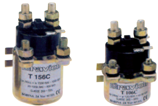
Serie T106/T156/T206/T154 Unipolari e unipolari 1NA+1NC 120A/150A/180A