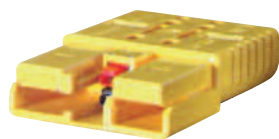
Serie SRE 160A