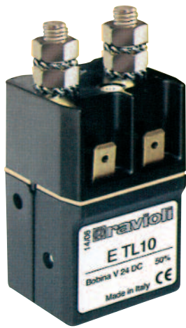
Serie TL10 Unipolari 100A