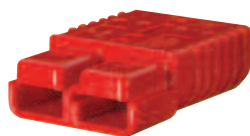
Serie SR 50/175/350A