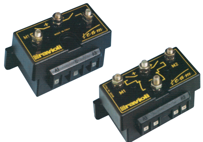
Serie TE106/TE156 Teleinvertitori 120A/150A