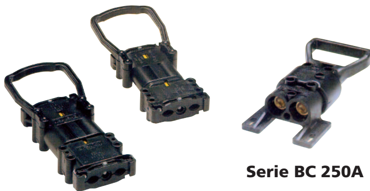
Serie BC 80/160/320A