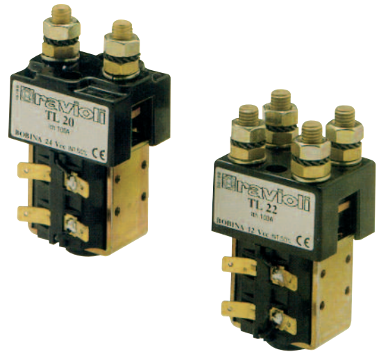
Serie TL20/TL25/TL22 Unipolari e bipolari 150A