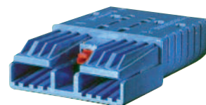
Serie SRX 175/350A