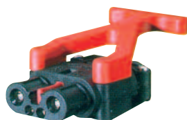
Presa FT 80A